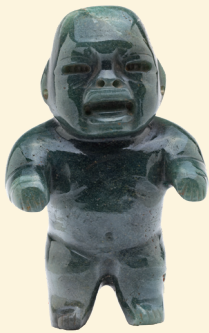
オルメカ様式の石偶

この日は、中学生以下のお子様と保護者の方のみが観覧できる特別な一日。夏休みの小学生はもちろん、未就学児も大歓迎！観覧中、子どもが騒いでしまったらどうしよう…となかなか観覧会に足を運ぶことのできない保護者のみなさんも、ゆっくり観覧会をお楽しみいただけます。ベビーカーももちろん大歓迎。赤ちゃんが泣きだしても「お互い様」。アーティストとコラボしたワークショップや研究員によるQ&Aコーナーもご用意。夏休みの思い出づくりに、家族のお出かけに、お子様のミュージアムデビューに、古代メキシコ展「こどもの日」をご活用ください！