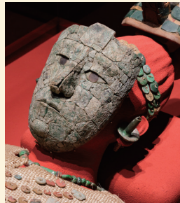
赤の女王のマスク・冠・首飾りの展示風景