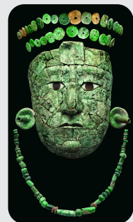
赤の女王のマスク・冠・首飾リマヤ文明,7世紀後半ハレンケ,13号神鏡出土アルベルト・ルス・ルイエハレンケ遺跡博物館

X(旧twitter)で「#古代メキシコ展」をつけて投稿 or フォロー&RTで抽選で3名様に展覧会オリジナルグッズをプレゼント!!